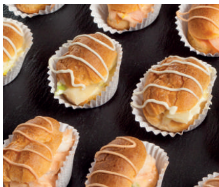
Petisus rellenos Entrantes