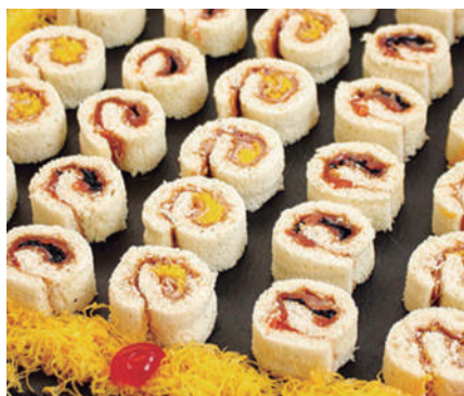
Mini manta Entrantes