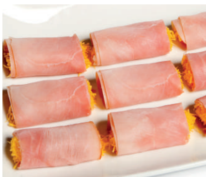
Rollitos jamón cocido y huevo hilado Cortados

Ración (500grs) 22,00€ 1/2Ración (250grs) 14,00€