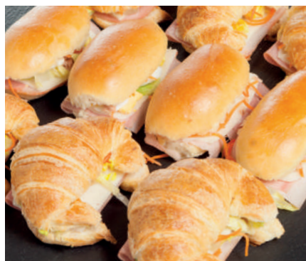
Bollitos vegetales Entrantes