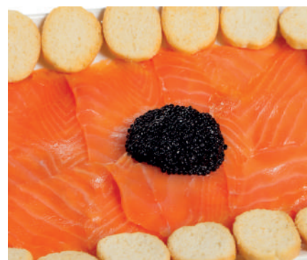
Bandeja salmón ahumado Cortados

Ración (600grs) 60,00€ 1/2Ración (300grs) 35,00€