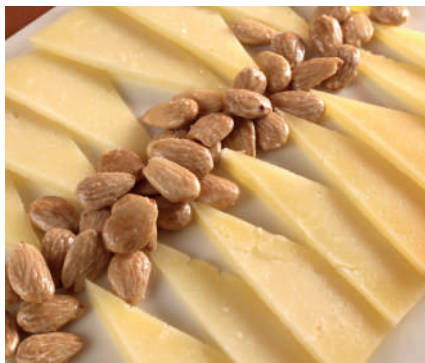
Bandeja queso Cortados

Sin jamón: Ración (500grs) 28,00€ 1/2Ración (250grs) 17,00€