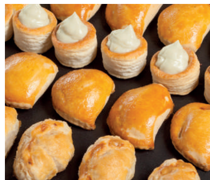
Aperitivos surtidos Entrantes

Atún, jamón cocido, queso, sobrasada y paté 27,00€/kg