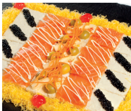
Bandeja canapés Entrantes

Salmón y caviar sucedáneo Bandeja 48,00€ | ½ 26,00€