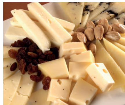
Surtido quesos Cortados

Semicurado: Ración (600grs) 19,00€ 1/2Ración (300grs) 12,00€