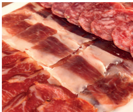
Surtido ibéricos Cortados

Serrano: Ración (300grs) 17,00€ | 1/2Ración (150grs) 9,00€