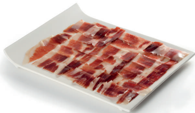
Surtido jamón Cortados

El aperitivo perfecto para sus reuniones. Le ofrecemos esta variedad de bandejas con productos de primera calidad recién cortados, para que pueda disfrutar al máximo de esta exquisita combinación de sabores.