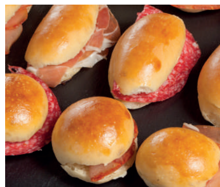
Bollitos variados Entrantes